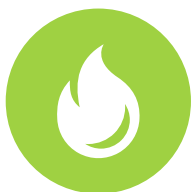
Tabla de calorías