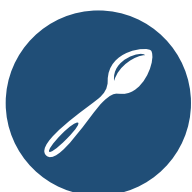
Tabla de tamaño de porciones